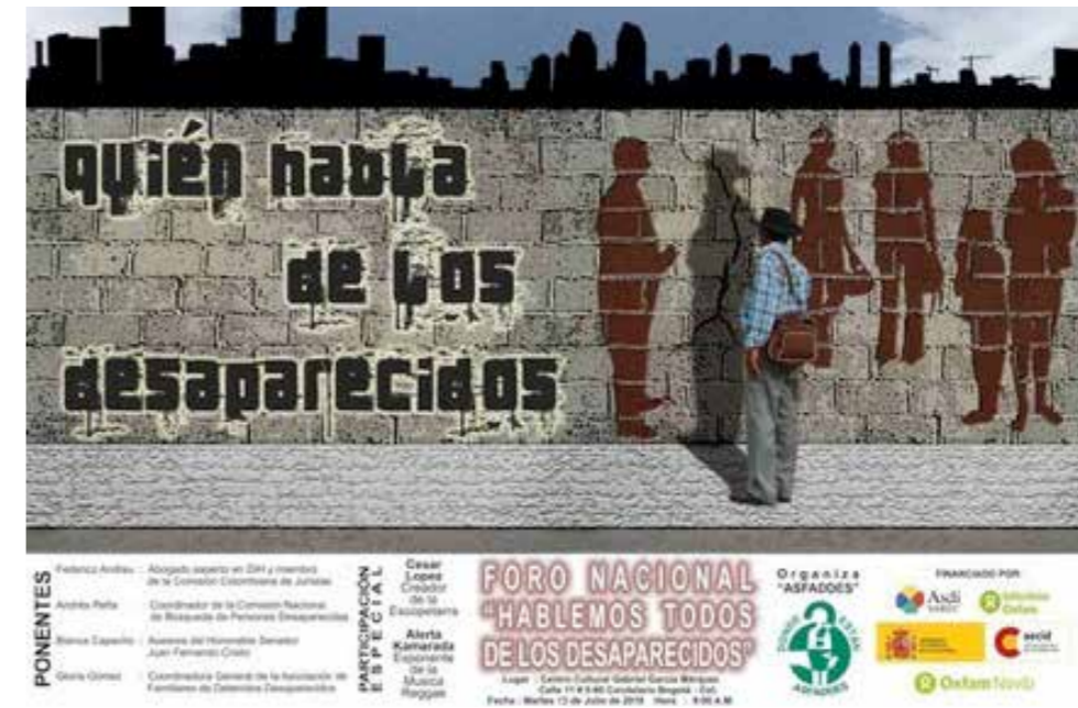
ASFADDES: "Quién habla de los desaparecidos"