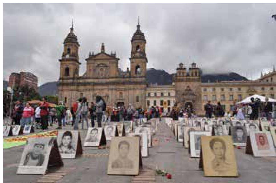
ASFADDES, 24 de mayo de 2015, Galería de la memoria en Plaza Bolívar