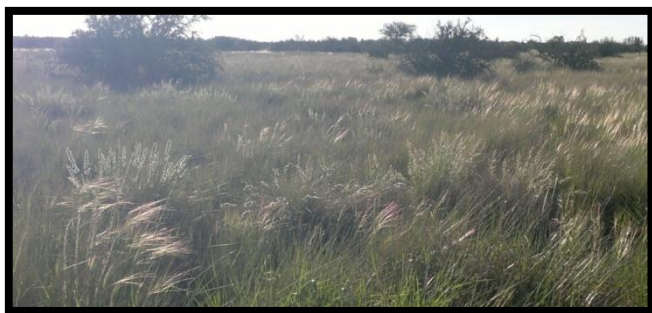
Figura 2. Especies de gramíneas perennes en estudio.

Para estudiar los efectos de la defoliación, se realizaron dos cortes en cada año de estudio: uno en el estadio morfológico de desarrollo vegetativo, y el otro inmediatamente luego de la diferenciación del ápice vegetativo en reproductivo. Se marcaron sitios sin vegetación y plantas correspondientes a las tres especies, de las cuales la mitad fue defoliada en las fechas indicadas anteriormente.