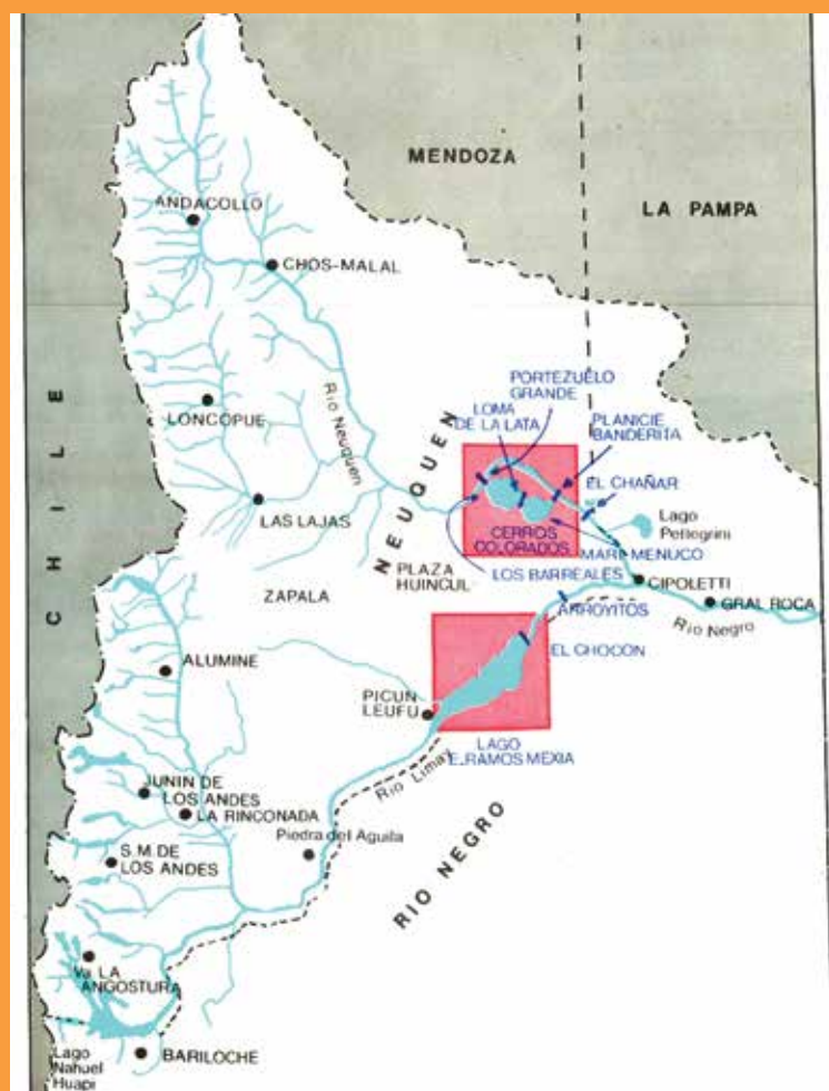
Figura 2: Esquema de los embalses norpatagónicos

La homologación de la obra a la experiencia de Assuan explicita el desafío