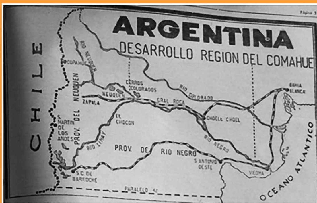
Figura 4: Mapa de la infraestructura de la región Comahue según el diario Río Negro

Fuente: Diario RN, 13 de octubre de 1966. P.3