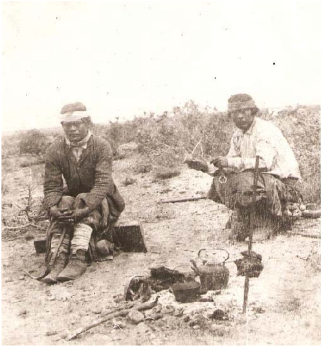
Figura 2. Dos hombres mapuche alrededor de una porción de carne asándose al fuego en una varilla simple y dos pavas al costado, sobre las brasas.