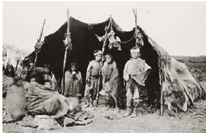
Figura 1. Toldo tehuelche en el que se observan varias bolsas (quizás conteniendo artículos de consumo) colgadas de los soportes del frente. En primer plano, un grupo de personas alrededor de una olla sobre el fuego. Fotografía de la Expedición Princeton a Patagonia 1896-1899 (los tomos digitalizados son accesibles en https://archive.org/ )