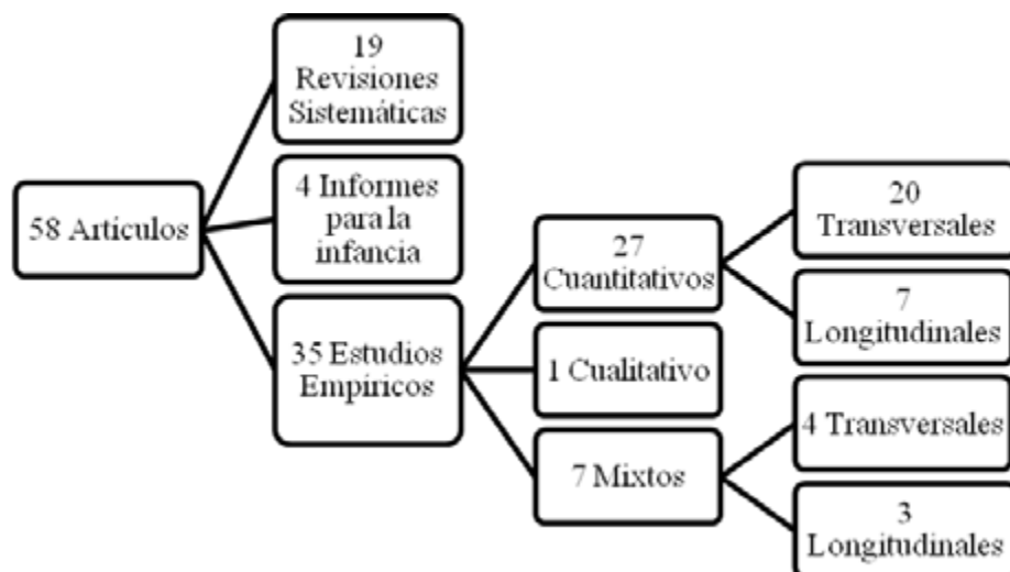
Figura 1. Clasificación metodológica de los artículos seleccionados.

2007; Valgañón, 2014), y los otros tres, con diseño longitudinal, descriptivos-correlacionales (Amorós et al., 2003; Molero Mañes, Gil Llarío, y Díaz Rodríguez, 2014; Molero Mañes y Moral Valderas, 2009).