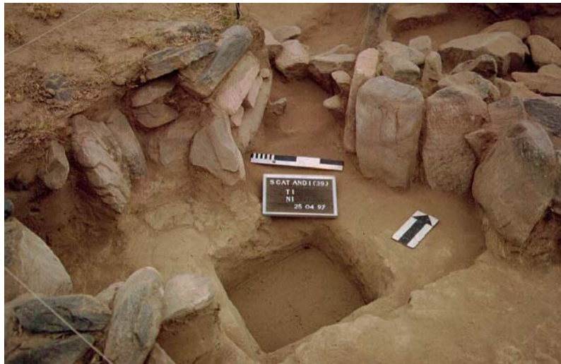
Figura 3. Detalle de técnica de construcción del muro

La abertura de dichas estructuras puede ser hacia el exterior o interior del recinto mayor, siendo esta muy estrecha (Figura 4).