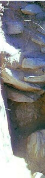
Figura 4. Vista de la estructura anexa tomando en detalle la puerta de acceso al recinto mayor (Recinto 23).