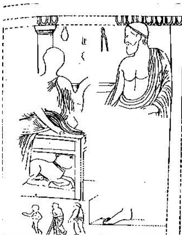
Fig. 3. Pínaux con representación de la llegada de Asclepio y Hygíeia a Atenas. Beschi 1969, 411.

https://es.slideshare.net/vplaarmengot/espacios-atenas-clasica-c , fig. nº 15.