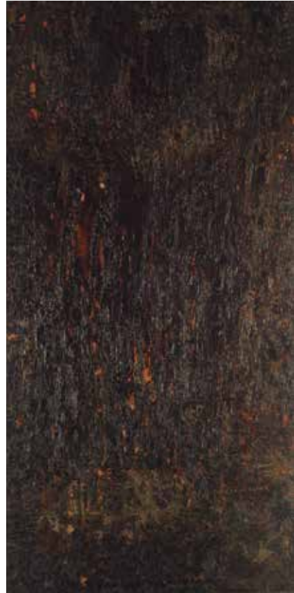
3. Alberto Greco, sin título, de la serie “Pinturas negras”, 1960, brea, bleque y óleo sobre tela, 2 x 1 m. MNBA, Buenos Aires.

las tradiciones del arte moderno en Buenos Aires, Río de Janeiro y Bogotá. 51 Tomar estos tres monocromos me permite situar los distintos momentos de la abstracción sudamericana, los procesos de consolidación y sus crisis.