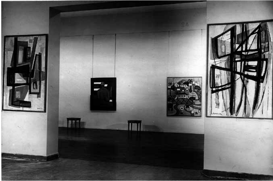
1. Vista de “Arte moderno en Brasil”, Museo Nacional de Bellas Artes (en adelante MNBA), Buenos Aires, 1957. Al frente obras de Firmino Saldanha y en segundo plano A negra y Estação Central do Brasil , de Tarsila do Amaral.

rio La Tribuna 34 en los cuales, aunque señalaba la importancia de la muestra para el medio, marcaba la fragmentaria selección realizada de la plástica europea; por ejemplo, lamentaba la ausencia de los maestros de la Escuela de París y criticaba la selección de los artistas franceses contemporáneos. Además, Plá destacaba que más allá de la talla de los artistas presentes era muy cuestionable la calidad de las obras elegidas dentro de la producción de cada una de estas figuras. En este sentido refería especialmente a Gino Severini y a Giorgio de Chirico de quienes mencionaba sus aportes a la renovación artística del siglo XX, pero aclaraba que éstos no eran visibles en las obras presentes en la