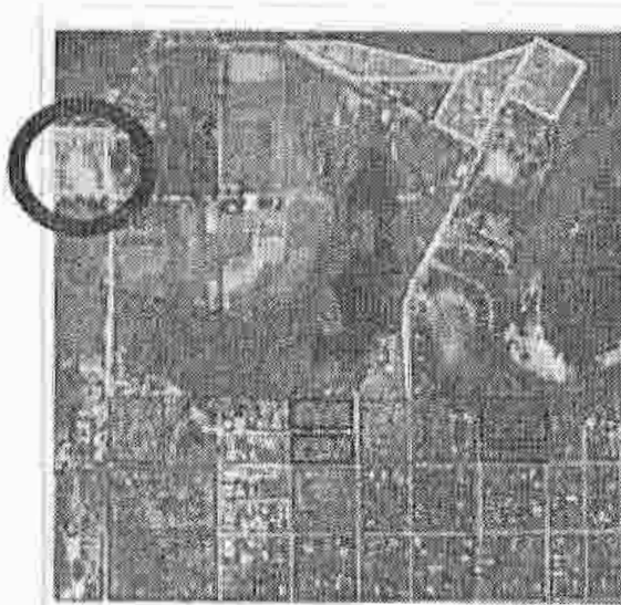
3. Identificación del Sector en el A.M.G.R.