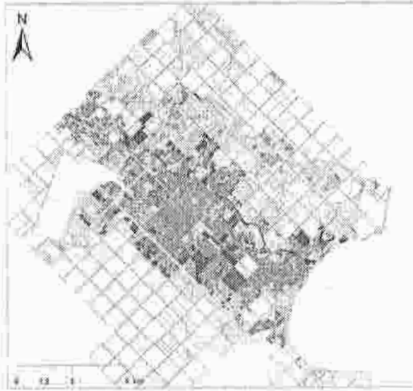
1. Identificación del Sector en el A.M.G.R.