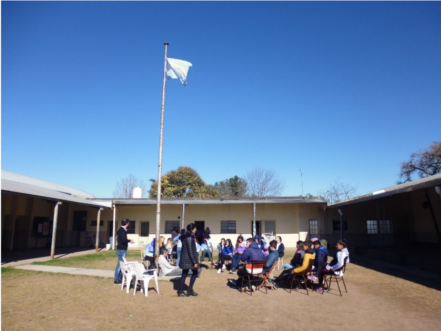
Figura 3. Talleres en la escuela (año 2018).

En 2018 se propuso elaborar un guión de un documental (Figura 3). El disparador fue pensar (y pensarse) en la “identidad gabotera”, utilizando el teléfono celular como herramienta para que cada estudiante pudiera registrar aquello que le pareciera importante de su cotidianidad. Se indagaron ciertos puntos o ideas que los alumnos consideraron de relevancia para contar a un posible visitante de la localidad y se recuperaron aquellos lugares significativos del paisaje. A partir de esto se redactó un guion que orientó a los distintos equipos en la realización del audiovisual. El producto de este taller fue presentado en el Encuentro Regional “Voces que construyen identidad” realizado en la escuela de Puerto Gaboto en esa ocasión, donde también los estudiantes se ocuparon de las visitas al sitio arqueológico.