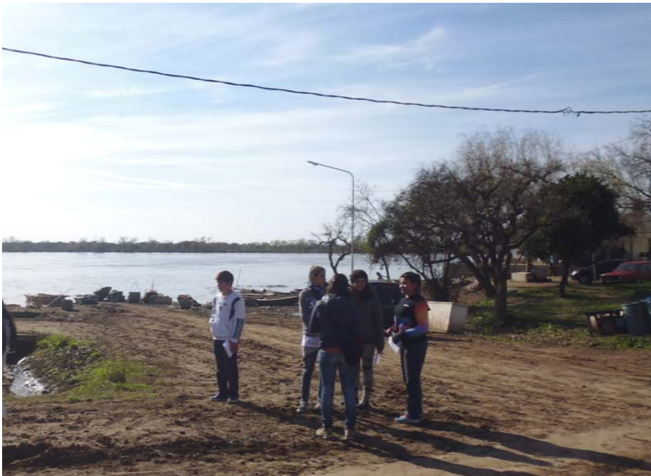
Figura 2. Talleres en torno al paisaje (año 2016).

Luego, en 2016, se propuso la realización de un taller en torno al paisaje (incorporando la flora nativa y la fauna extinta), en donde se trabajó sobre la noción de “paisaje historizado”, permitiendo reflexionar acerca de las continuidades y reutilizaciones del espacio en donde se encuentra Puerto Gaboto (Figura 2). La propuesta fue ir más allá del momento de ocupación del Fuerte y profundizar en una historia que transcurre desde las poblaciones indígenas hasta el presente. Una historia de la que todos formamos parte.