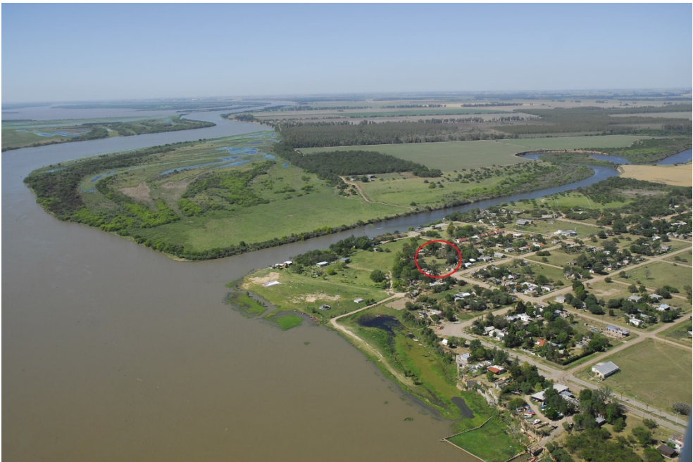
Figura 1. Vista de Puerto Gaboto, indicando el sitio arqueológico.

En este sentido, la investigación arqueológica iniciada en el año 2006 planteó la localización del Fuerte entre sus primeros objetivos. En 2009 el proyecto contó con el apoyo de la Agencia Española de Cooperación Internacional para el Desarrollo (AECID) y en 2010 un equipo de la Universidad del País Vasco (Grupo de Investigación en Patrimonio Construido, GPAC), se suma a los profesionales locales. A partir de ese momento, los estudios realizados sobre distintos materiales extraídos del sitio y la incorporación de nuevas técnicas y metodologías en el trabajo de campo, permitieron confirmar dónde se encontraban las estructuras constructivas y demás restos de este asentamiento (Azkarate et. al. , 2013; Cocco y Letieri, 2009; Letieri, Cocco, Frittegotto y Sánchez Pinto, 2015; entre otros). Este lugar había sido inicialmente denominado como “Sitio Eucaliptus”, y se ubica en una zona de barrancas apenas elevadas sobre el extenso bajo que anticipa el encuentro del Coronda con el Carcarañá, en un sector poblado de Puerto Gaboto.