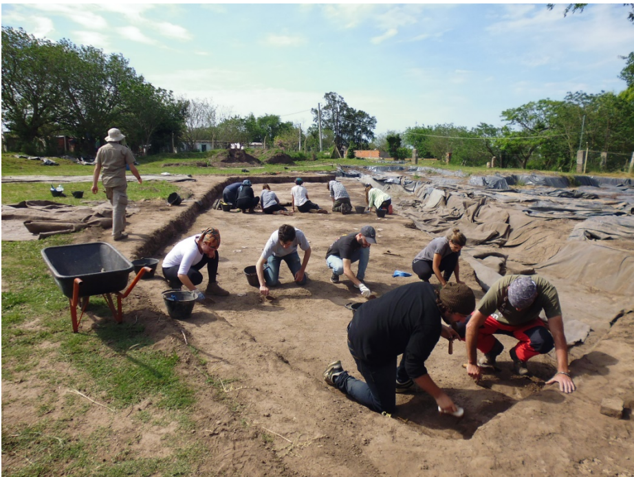
Figura 4. Escuela de Campo (año 2018).

La segunda etapa se desarrolla en el sitio propiamente dicho y consiste en la puesta en práctica de la metodología abordada en el curso, realizando todas aquellas tareas propias de la intervención arqueológica en campo, es decir, excavación, reconocimiento de estructuras, sedimentos y materiales, medición tridimensional de los hallazgos, utilización del sistema de registro en planillas, sólo por mencionar algunas de ellas.