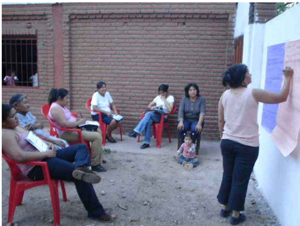
Foto. Mujeres de Yariguarenda participando en las reuniones preparatorias del Encuentro de Mujeres, dirigentes y organizaciones, Centro Cultural Tartagal, octubre de 2006.