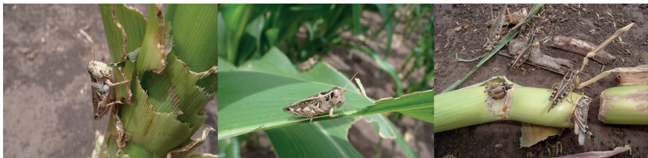
Figura 2. Individuos adultos de Dichroplus maculipennis en plantas de Maíz. Diciembre de 2009, Benito Juárez, provincia de Buenos Aires.

Además, estas investigaciones permiten tener una aproximación de las pérdidas económicas y de la disminución de la productividad de un pastizal (De Wysiecki y Sánchez., 1992; Onsager, 2000; Branson et al., 2006).