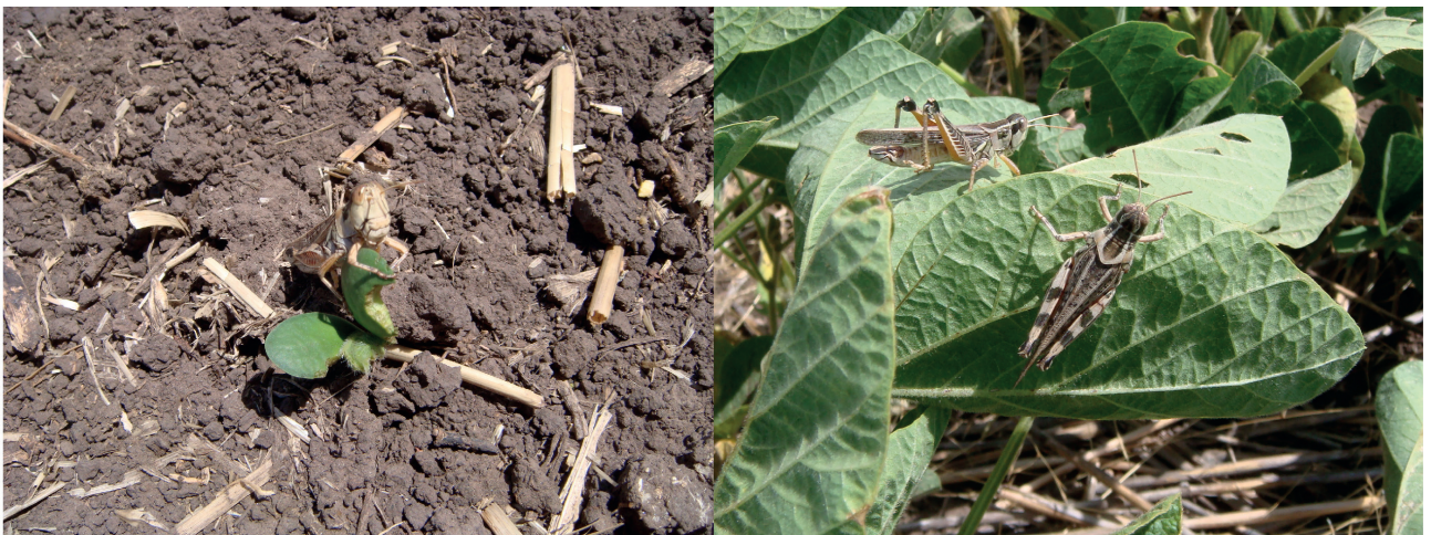
Figura 1. Individuos adultos de Dichroplus maculipennis en plantas de soja. Diciembre de 2009, Benito Juárez, provincia de Buenos Aires.

y Sánchez, 1992; Onsager, 2000; Branson, 2008). A altas densidades pueden destruir plantas enteras o grandes porciones de ellas, produciendo una disminución en la superficie fotosintética, inhibiendo la reproducción vegetativa y disminuyendo las reservas radicales (Hewitt y Onsager, 1983). En diversos estudios se ha estimado la pérdida de forraje ocasionada por diferentes especies de tucuras, determinándose que la cantidad de forraje consumido por los individuos se incrementa con los estados de desarrollo del insecto, siendo en el estado adulto cuando ocasionan la mayor pérdida (Putnam, 1962; Hewitt et al. , 1976; Hewitt, 1978; Sánchez y de Wysiecki, 1990; Bulacio et al. , 2005; Torrusio et al. , 2009; Mariottini et al. , 2011a, entre otros).