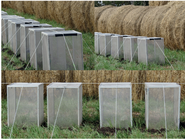
Figura 3. Jaulas de aluminio utilizadas en la experiencia.

las. Para estimar la biomasa vegetal inicial de la pastura se tomaron 5 muestras cosechando la vegetación presente en 0,25 m 2 .