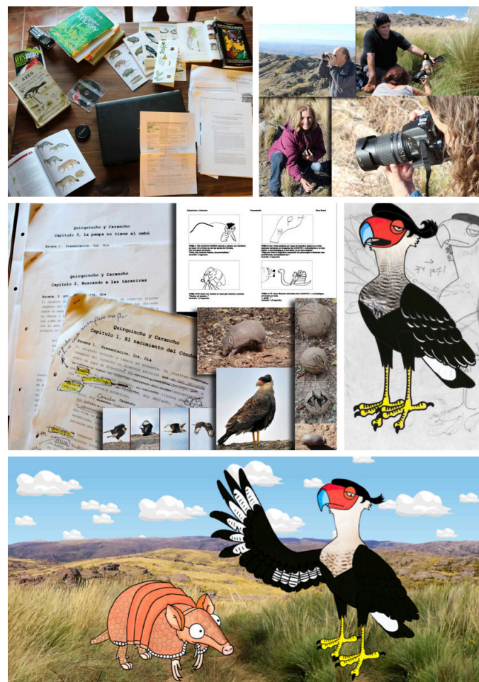
Figura 2: Etapas de producción: investigación, viajes de campo y registro fotográfico y audiovisual, guión, storyboard, diseño de personajes y propuesta estética final.

Página web: Se diseñó la página de "Quirquincho y Carancho" para lo cual se creó un sitio wordpress en el Datacenter de la Prosecretaría de Informática de la Universidad Nacional de Córdoba. Hasta el momento se cargó información relativa al capítulo 1 de la serie y será actualizada periódicamente (Figura 1). Las principales solapas son: PERSONAJES: Descripción de cada personaje incluyendo información científica sobre el animal en lenguaje infantil con un relato en primera persona, dibujos y fotos reales. PLANTAS: Descripción de