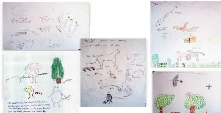
Figura 3: Dibujos realizados por niños en los Talleres en La Sierrita y en Los Gigantes

y representaciones simbólicas se vieron reflejadas en historias de dibujos animados. En más de una ocasión los niños expresaron su deseo de ver el corto repetidas veces. Durante el visionado del corto, los alumnos reconocieron los escenarios naturales de la región, la fauna nativa y algunas especies vegetales representadas. Las impresiones de los alumnos de Los Gigantes fueron vertidas en una nota que realizaron para una revista escolar: "Desde nuestro punto de vista el video nos parece que es una buena forma de aprender más sobre la flora y la fauna de nuestra región. Pudimos reconocer distintas especies que forman parte de nuestra naturaleza y la tonada cordobesa de algunos animales, el humor del video es fantástico y hace muy amena y divertida la visión" .