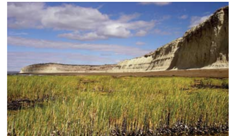
Arriba. La distribución de la vegetación de marismas suele presentar un claro patrón de zonificación, en franjas paralelas a la línea de costa. En la zona amarillenta predominan los espartillos de la especie Spartina densiflora ; en la verde oscuro, los de Spartina alterniflora .