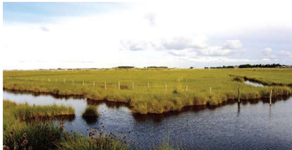
Típica marisma de Spartina de las costas bonaerenses, reparada de las olas y con amplios canales de marea comunicados con ríos y arroyos caudalosos que, en época de lluvias, provocan grandes inundaciones y favorecen el establecimiento de comunidades mixtas de plantas tolerantes a altas salinidades con otras que no lo son.