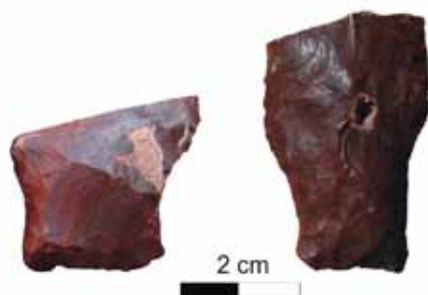
Figura 8. Fragmentos de puntas de proyectil “cola de pescado” de la localidad Estancia La Suiza

bilidades para el estudio de este tema con nociones teóricas desde los estudios de poblamiento y de organización de la tecnología. Este último tema, nos permite discutir las diversas estrategias de producción de instrumentos (manufactura, transporte, uso, mantenimiento y descarte) que una sociedad implementa para resolver sus necesi-