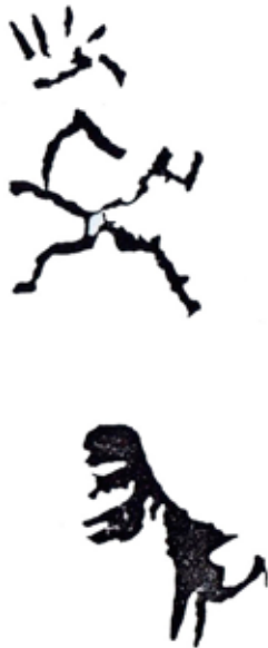
Figura 4. Representación del arte rupestre de Intihuasi (Vignati, 1936a).

Es interesante una de sus observaciones sobre el hallazgo en Paso de las Carretas, depto. Pringles, de núcleos de cuarzo blanco con sus respectivos desechos de talla (Vignati, 1940b), ya que intuye la producción de artefactos y reconoce características petrológicas similares entre los núcleos y desechos para aseverar que pertenecen a un mismo tipo rocoso. Sin embargo, similarmente al pensamiento de Outes, Vignati intenta en sus trabajos describir rasgos que le permitan definir una cultura para establecer similitudes y diferencias con otras culturas a partir de los objetos materiales.