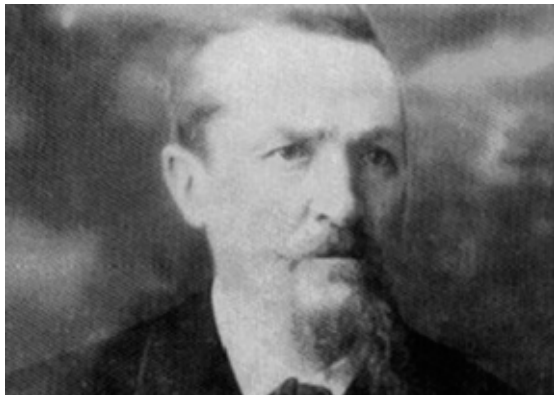
Figura 1. Imagen de G. A. Lallemand. Publicada por Roberto Ferrari (1993)

En sus incursiones por San Luis se refiere al “hallazgo de diferentes objetos trabajados por los indígenas, especialmente un cuarzo y esquistos talcosos; provenientes los más de ellos de la sierra de San Luis, en las inmediaciones de los cerros del Valle y de Intihuasi”. Menciona “puntas de flecha y lanza de tamaños que variaban entre los 5 y los 9 centímetros de largo, alcanzando una de ellas hasta los 10 centímetros” (Lallemand, 1882: 138, en Vignati, 1940a: 156). Se trata de una de las primeras referencias sobre materias primas líticas y sus fuentes de aprovisionamiento.