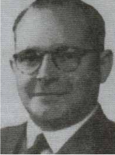
Figura 3. Publicada por Podestá (2007).