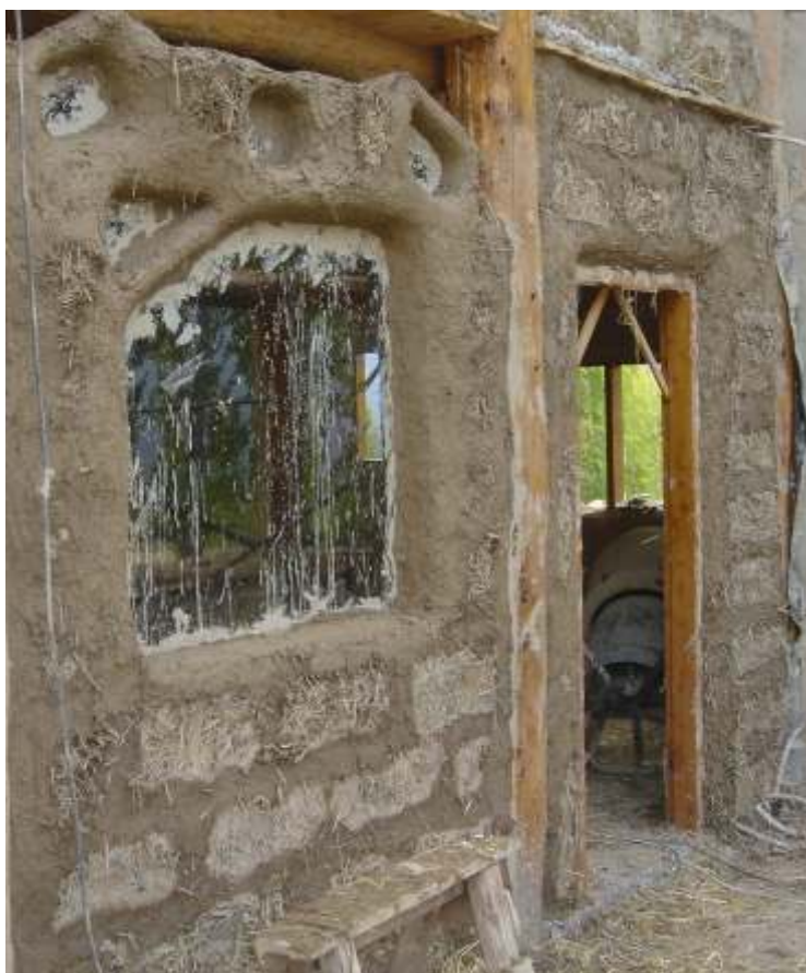
Figura 3: pared cerrada con bloques de paja y arcilla y junta de paja, arcilla y arena.

Para formar la pared se asientan con una mezcla similar a la usada en los bloques pero con agregado de arena, y con la misma se realiza el revoque (estuco) grueso. Por m 2 de pared se usan entre 7 y 8 bloques, quedando una pared terminada de unos 25 cm de espesor. Para que los huecos no se llenen con el material pesado de la junta de asiento, a medida que se colocan se rellena el hueco con paja de cereal. De esta manera la mezcla de asiento queda horizontal. La aislación térmica resultante es muy buena, alrededor de 5 veces mejor que la de ladrillos cocidos comunes, y 4 veces mejor que la de bloques de concreto o de adobes (ladrillos no cocidos). Por esto se los llama en general bloques térmicos. En la Figura 3 se muestra una pared terminada antes de realizarle el revoque grueso.