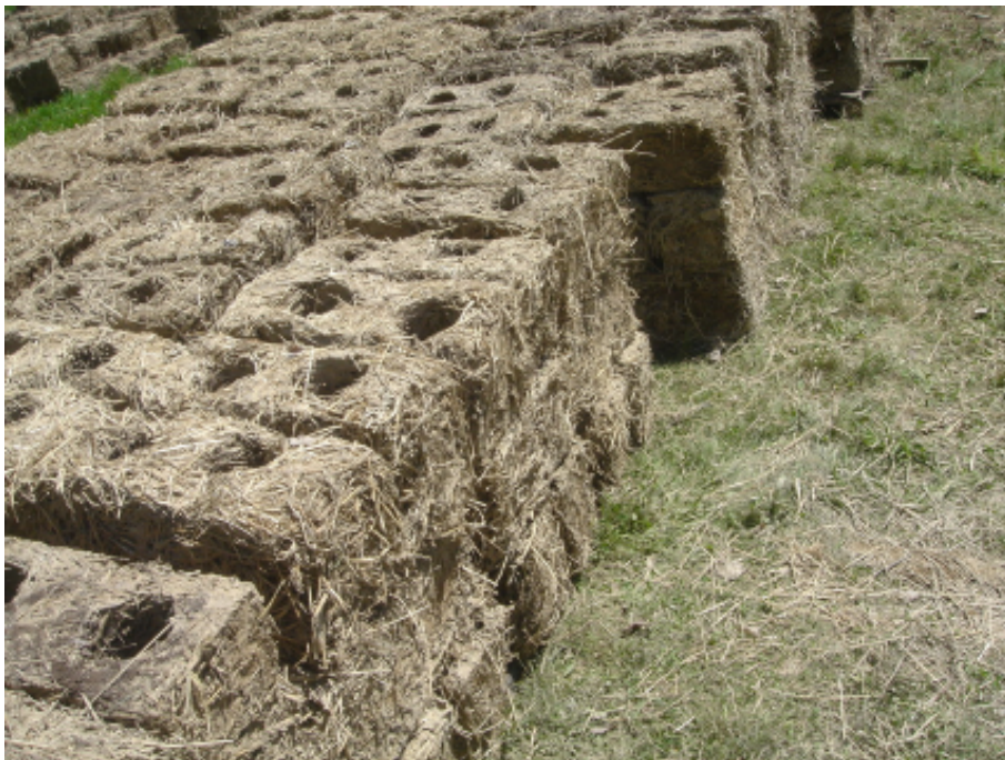
Figura 2: los bloques se secan al sol.

Cada bloque seco pesa entre 4 kg y 7 kg, con un promedio de 6 kg. Se dejan dos espacios vacíos para alivianarlos. Noten que un bloque similar de concreto pesa 13 kg. La fabricación de bloques para una casa de 100 m 2 usa cerca de 3500 kg de arcilla.