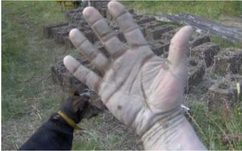
Figura 1: el moldeo se hace a mano comprimiendo la mezcla en un molde de madera

sol como muestra la Figura 2. La arcilla no daña la piel pero algunos componentes en la paja de cereal (lignina) pueden resultar agresivos.