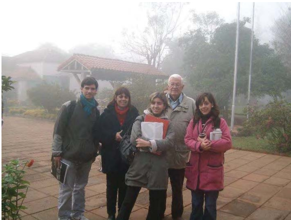
Fig. 4. Uno de los últimos viajes a Misiones con discípulos y alumnos, en la entrada de San Ignacio Miní (2008).

una vida austera y silenciosa, ajena a los halagos que suele otorgar el poder en cualquiera de sus manifestaciones, con un comportamiento constante de sobriedad, sin ambages ni petulancias” (Vargas Gómez, 2005, p. 5).