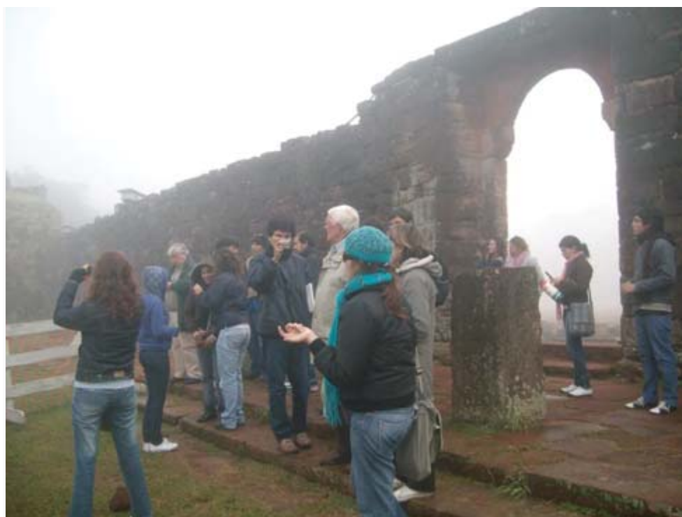
Fig. 5. Con alumnos de la Universidad en San Ignacio Miní (2008).