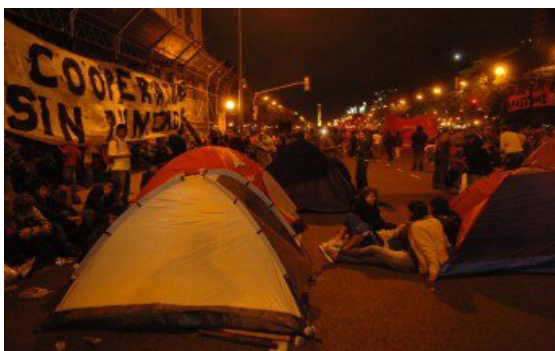
3 de noviembre de 2009.