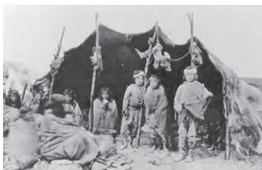
Figura 2. Arriba: Grupo de mapuches posando frente a lo que aparenta ser un rewe y exhibiendo múltiples artefactos típicamente mapuches como platería, cerámicas, una trutruca (instrumentos musical de viento) y un cupelhue o cuna vertical. Fotógrafo y fecha desconocida. Museo Mapuche “Juan Antonio Ríos”, Cañete, Chile. Abajo: Familia tehuelche posando en un toldo, se observan artefactos autóctonos, como los que cuelgan de los postes del toldo, y artefactos foráneos, como el mate que sostiene uno de los individuos. Fotógrafo y fecha desconocida. Museo de la Patagonia, Bariloche, Argentina