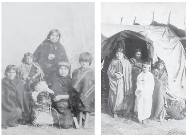
Figura 1. Derecha: Mujeres y niños mapuche posando en estudio fotográfico. Gustavo Milet Ramirez, 1890. Rijksmuseum voor Volkenkunde, Leiden, Holanda. Izquierda: Mujeres tehuelche posando frente a un toldo. Fotógrafo y fecha desconocida. Museo de la Patagonia, Bariloche, Argentina

y Bahn 1998:43) con los cuales fueron retratados los indígenas, que remiten a las elecciones de representación tanto del fotógrafo como del fotografiado.