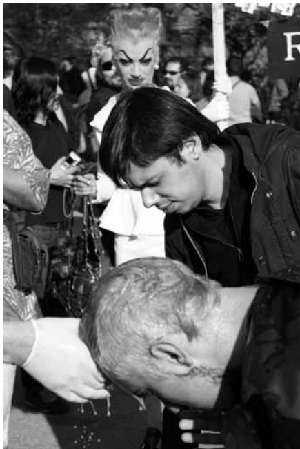
Imagen 4. Fotograma de Rubias para el Bicentenario (2010).

Otro de los procedimientos reconocibles podría ser el de la teatralización como artificio poético, tal el caso del documental argentino Rosa patria (2009) de Santiago Loza, presentado en el sexto festival Diversa. Denominada por su propio realizador como un “documental teatral”, la película se postula como un intento de reconstrucción posible de algunos aspectos de la vida y la obra de Néstor Perlongher. A sabiendas de que la memoria es un mosaico de imágenes de diferentes registros y texturas y ante la carencia audiovisual de ese archivo, se opta por una ampliación asociativa de lo que los testimonios registrados por Loza despliegan en su evocación. Así la performance poética de María Inés Aldaburu interpretando la poesía de Perlongher, las canciones interpretadas por Carlos Casella, las teatralizaciones de Maruja Bustamante, Gael Policano Rossi y Leandro Airaldo de ciertos episodios de la vida cultural de los setenta van anudando una trama ficticia como manto de opacidad ante la supuesta “verdad” del testimonio oral. Aquí los usos del testimonio se tensionan con el artificio de lo teatral (la mostración del proceso de ensayo o las pruebas de cámara previas a que la o él entrevistado comiencen a responder).