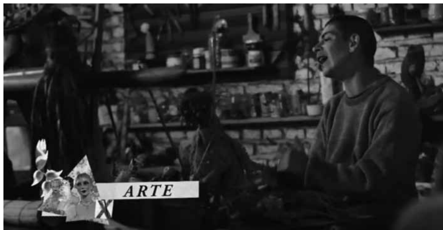
Imagen 2. Fotograma de El Jardín de las delicias (2011).

Tal vez en este sentido, y en un intento por trazar un mapa de la geografía audiovisual sexo-disidente en el cine documental rioplatense, podríamos anclar un momento central del trayecto hacia una visibilidad sexo-disidente (luego de décadas de una artillería audiovisual altamente transfóbica) en el corto documental La Otra (1989) de Lucrecia Martel. En ese trabajo estudiantil de la directora vemos algo inusual para el cine local y para los estudios teatrales latinoamericanos: el foco en las prácticas transformistas 1 . Reivindicando un posicionamiento específico dentro del campo, construye un archivo desviado del canon. El corto adquirió difusión años después de su producción, en un contexto muy diferente del activismo trans en el país y de los posicionamientos de las personas transfemeninas. Allí, los discursos de las personas entrevistadas no se ponen en relación con las organizaciones existentes para fines de los ochenta ni parecen atravesados por esas luchas por lo cual presentan ciertos matices transfóbicos, por momentos. Aún así, los testimonios que presenta resultan centrales para la construcción de un archivo audiovisual de las prácticas teatrales de disenso sexopolítico (que, asimismo, permite ser contrastado con las producciones que contemporáneamente llevaban adelante en múltiples escenarios Batato Barea, Alejandro Urpilleta y Humberto Tortonesse entre otros).