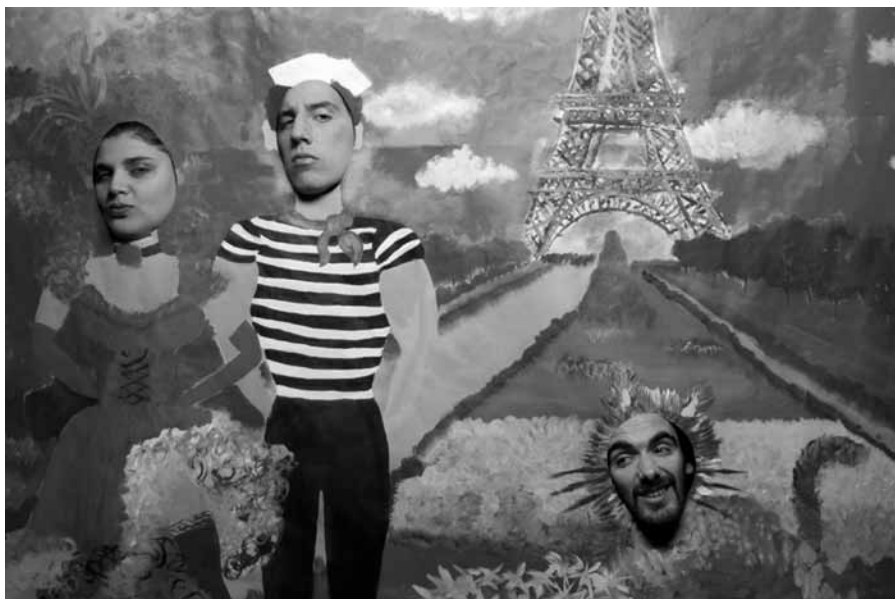
Imagen 5. Fotograma de Rosa Patria (2009).

La divergencia de las voces que testimonian está trabajada también, aunque de otro modo, en La peli de Batato (Anchou y Pank, 2011). En este caso sí se evidencia la intervención sobre un archivo múltiple a la cual se le añade una acentuación manifiesta de la multiplicidad de voces. En este documental se integran varios procedimientos aunque lo que mayormente se privilegia resulta ser la intervención de los diferentes archivos audiovisuales preexistentes, registros de las performances que Batato Barea dejó a resguardo de ciertos amigos, fruto de la voluntad por construir su archivo personal. La película evoca al auto-definido clown-travesti-literario y su fusión de arte y vida.