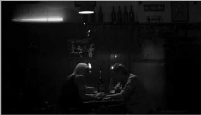
Imagen 3. Fotograma de La Noche (2016)

En línea con la propuesta de Fermín Acosta arriba citada y a diferencia de la asimilación pretendida por ciertos films con intenciones de masividad, se observan otro tipo de ficciones que plantean intervenciones más radicales respecto de la sexopolítica imperante, como la excepcional película chilena Empaná de pino (Edwin “Wincy” Oyarce, 2008). Aquí la performer Hija de Perra, si bien se pone al servicio de la narración que propone el film, permite acceder a su corporalidad y posicionamiento político disidente característico de sus performances urbanas. Es en estas ficciones donde aparece lo que podríamos observar un primer procedimiento reconocible: la frotación entre dos lenguajes cinematográficos que permiten, lateralmente, la construcción de un archivo. Archivo del cual incluso el propio teatro hace relecturas posteriores como el caso de la obra teatral chilena dirigida por Ernesto Orellana Cuerpos para odiar donde, mediante citas de registros audiovisuales del director de Empaná de Pino proyectados en escena (entre otros recursos) se evoca a Hija de Perra en la sala de la Universidad donde se desarrolla la función.