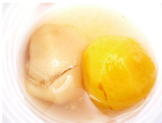
Figura 4. Jugo o compota de durazno con “durazno” blanco y amarillo común