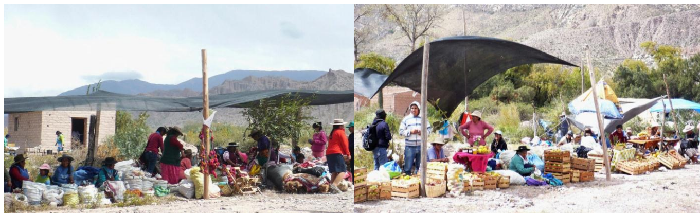
Figura 7. Puesto y productos que en la Feria del camalache y trueque, Juella (Abril 2015), a. productores de la Puna y b. productores de Quebrada

trueque. Estos productos también se encuentran a la venta, sin embargo siempre se esperará intercambiar antes de vender por ejemplo se separan los cajones de “duraznos” que ya reservó algún productor para intercambiar. En esta feria se expenden, además de recursos comestibles, otros medicinales, ornamentales, forrajeros, así como también ropa, utensilios de barro y cestería.