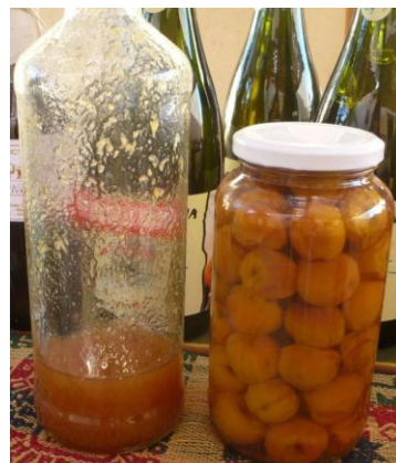
Figura 2 a. Licor de durazno, b. duraznos en almíbar

azúcares. Con estos pelones se prepara anchi, “mocochinche” y compota (Figura 4). Existen relatos de pobladores sobre la preferencia de elaborar pelones con los duraznos comunes, ya que al exponerlos al sol tardan en secar menos días. Los pelones se almacenan en cajas de cartón para su conservación posterior.