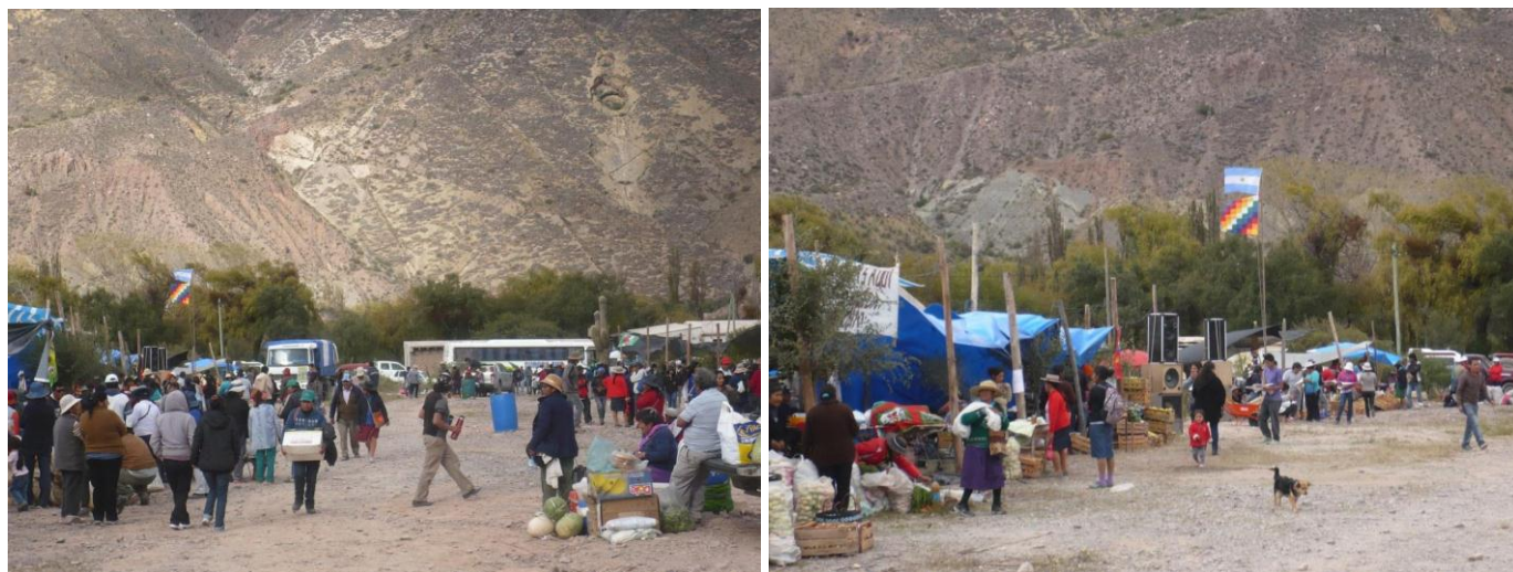
Figura 6. 19º Edición de la Feria del camalache y trueque, Juella (Abril 2015)

En esta ferias también existe una diferenciación de los puestos según el lugar donde se ubican (estructura de la feria) y la forma en que se presentan, característica que depende del área de procedencia del productor. Cada participante provee a la feria de los productos típicos y elaborados en su zona (Figura 7 a y b); durante dos jornadas los asistentes podrán abastecerse de ellos, desde temprano se visitan los puestos y comienzan las negociaciones para el