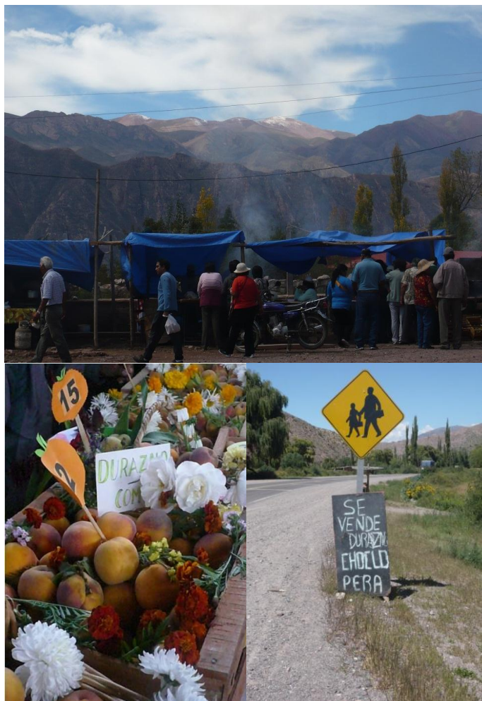
Figura 5. Distintas expresiones relacionadas con el cultivo de duraznos a. Festival del durazno en Juella (Abril 2014), b. cajones de duraznos que se expone al jurado en el festival, c. carteles donde se expone la venta de durazno

Este evento reúne a los pobladores de Juella que por diferentes motivos migraron a distintos puntos de la provincia; es muy común que lleguen familiares los cuales al volver a sus actuales lugares de residencia se llevarán distintos productos alimenticios entre los que se encuentran los “duraznos”.