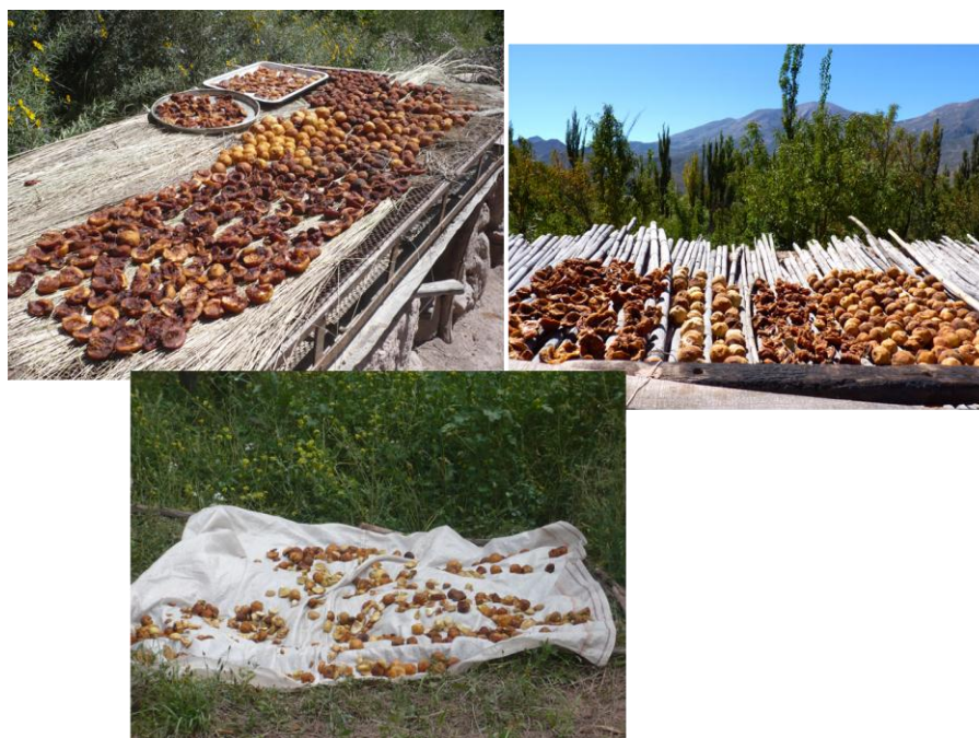
Figura 3. Secado de “pelones” de durazno