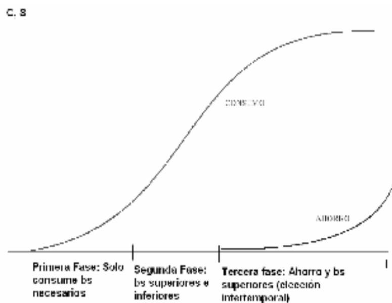
Gráfico 1. Fases del Consumo y Ahorro

Una exposición más atinada para aplicar a contextos de vulnerabilidad es realizada por Durán Ortiz (2007). El autor presenta un diagrama simple sobre las “fases de comportamiento natural del consumidor” (véase Gráfico 1), que en su forma se asimila a la exposición de Ray (1998) respecto de la curva de nutrición y capacidad laboral. Según este esquema la evolución del ingreso de los hogares condiciona la calidad y cantidad de bienes que los individuos/hogares consumen y, por tanto, su capacidad de ahorro. Así, los sectores de menores ingresos se ubicarán en la fase 1, con un nivel de ahorro nulo y enfocando sus esfuerzos en la satisfacción de necesidades básicas (principalmente alimentación).