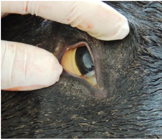
Figura 1. Ictericia de la mucosa ocular en un feto de 320 días de gestación con un diagnóstico presuntivo de leptospirosis.

do muestreo de la yegua, se colectó sangre de cada una de las demás hembras de la tropilla. Los sueros fueron analizados mediante la técnica de microaglutinación (MAT) frente a 8 serovariedades referenciales, Leptospira interrogans serovar Pomona, L. interrogans serovar Icterohaemorrhagiae, L. borgpetersenii serovar Castellonis, L. borgpetersenii serovar Tarassovi, L. interrogans serovar Wolfii, L. interrogans serovar Hardjo, L. interrogans serovar Canicola, L. kirshneri serovar Grippotyphosa. La dilución inicial del suero fue 1/100. Según los datos recabados en la anamnesis, la yegua no presentó sinología clínica previa al aborto. El feto se encontraba a término (320 días de edad aproximadamente) y a la necropsia se observó ictericia generalizada (Figura 1) con hemorragias petequiales y equimóticas, hepatomegalia y esplenomegalia.