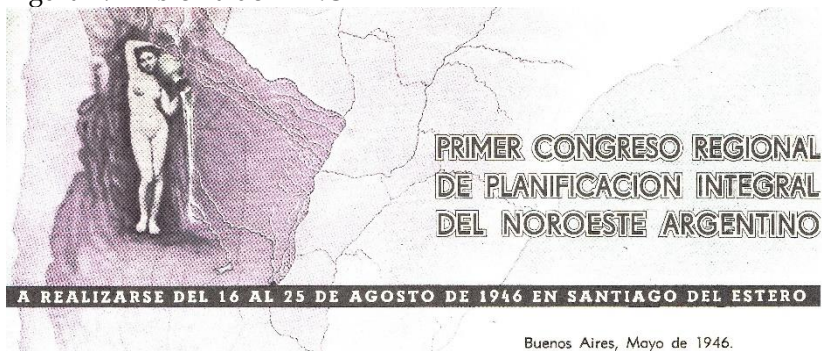
Figura 1. Emblema del PINOA