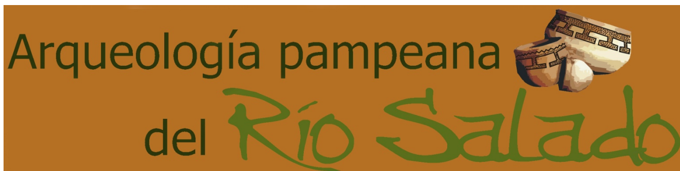
Figura 3: Isologo del sitio web (elaboración propia).

transferencia de resultados y convertirse en un espacio de encuentro y discusión sobre las implicancias de hacer arqueología en un lugar determinado.