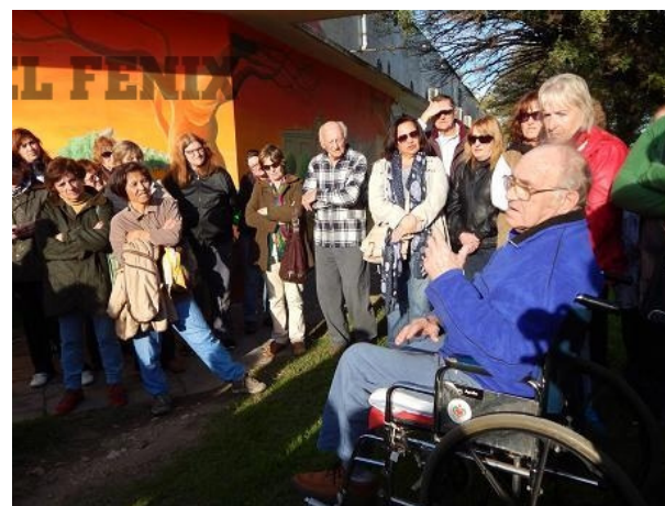
Imagen 7. Safari “Personas –que deberían ser inolvidables”.