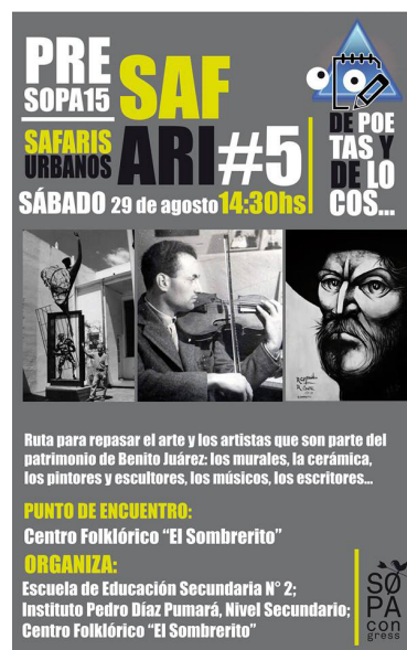
Imagen 4. Afiche del Safari “De poetas y de locos”