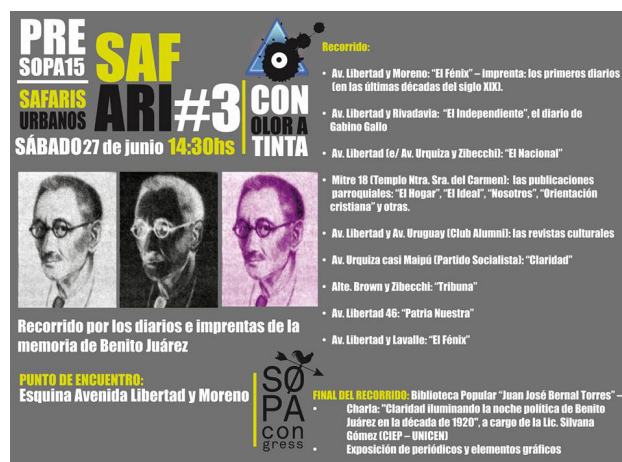
Imagen 3. Afiche del Safari “Con olor a tinta”.