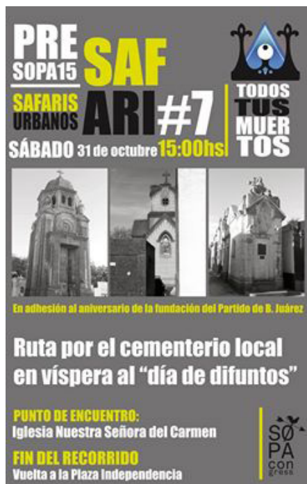
Imagen 5. Afiche del Safari “Todos tus muertos”.