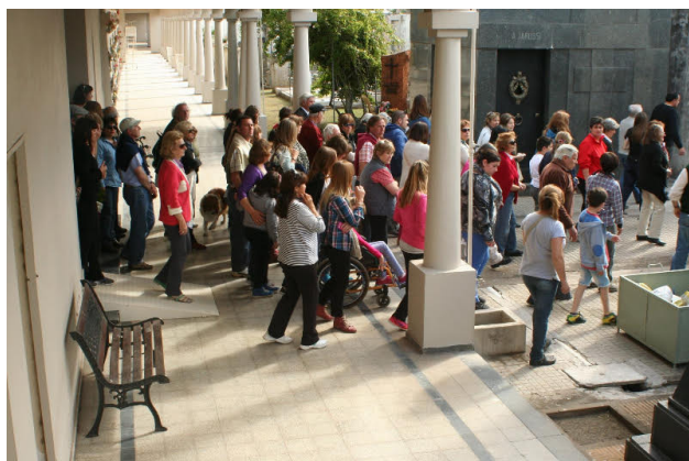
Imagen 6. Safari “Todos tus muertos”.