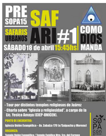
Imagen 2. Afiche del Safari “Como dios manda”.