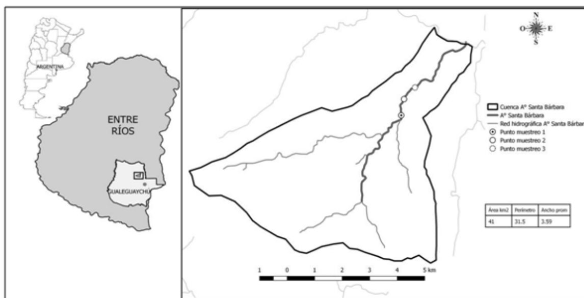
Figure 1. Study area of the Santa Bárbara stream with its drainage network. Scale: 1:70000. Graphics by author with data from QGIS (Quantum GIS v 2.14.0).

The morphometry of the basin was carried out following Gaspari et al. , (2013). The axial longitude (La) was calculated as were the perimeter (P), area (A) and average width (Ap) using QGIS Software (Quantum GIS v 2.2.0) and Google Earth © (2014). Thus the factor of the Gravenius form (IF) was calculated to calculate the runoff grade through the equation IF=Ap/La (Londoño-Arango, 2001; Gaspari et al. , 2013) and the coefficient of the compassity of Gravenius (Kc) to know the risk of growth spurts with the equation Kc=0.2821*(P/\sqrt{A}) (Londoño-Arango, 2001). Moreover, the parameters of the topography and of drainage were calculated with the QGIS Software QGIS. For the latter the drainage density was calculated ( Dd=\sum ni=nLn/A expressed in km/km^2 ), drainage longitude (Ln), longitude of the principal course (L),