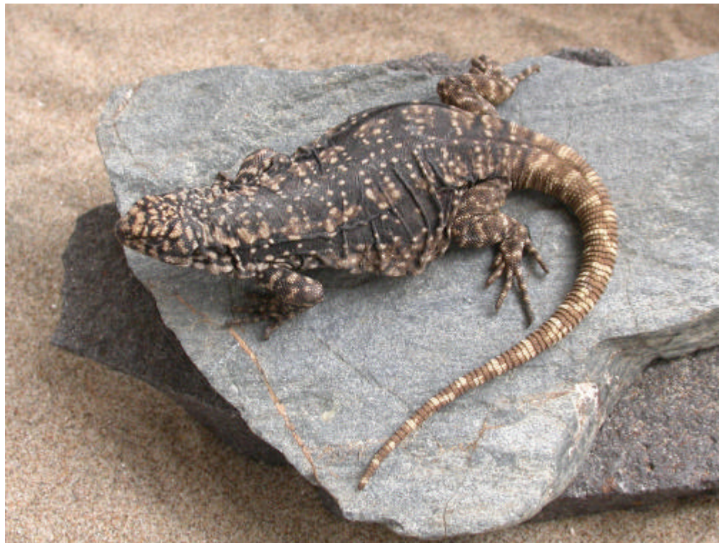
Fig. 1 A: Vista dorsal de la Hembra Paratipo de Phymaturus calcogaster , Laguna de Las Vacas, Telsen, Chubut.

En cuanto a la coloración, difiere del macho particularmente en la faz ventral, la que aparece menos intensamente cobriza, aspecto éste que etimológicamente justificara oportunamente la denominación específica. El patrón dorsal muestra una acentuada coloración oscura, con múltiples manchitas claras, blanco-cremosas, que se disponen de manera semicircular y seriada a lo largo de la línea vertebral (Fig. 1, A y B). Estas características se observan también en las hembras subadultas de la muestra. Ventralmente puede señalarse una atenuación en forma esfumada y difusa de las manchas irregulares oscuras que más notoriamente se observan en el macho Tipo siguiendo una disposición longitudinal irregular. La disposición de las manchas oscuras en estrías submandibulares, las irregulares negras gulares, y las de la superficie inferior de flancos y extremidades, no muestra diferencias relevantes entre ambos sexos.