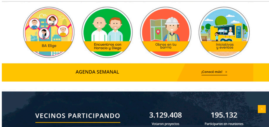
Figura 2. Página de inicio del sitio web de Buenos Aires Participación Ciudadana.