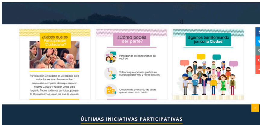
Figura 3. Página de inicio del sitio web de Buenos Aires Participación Ciudadana.