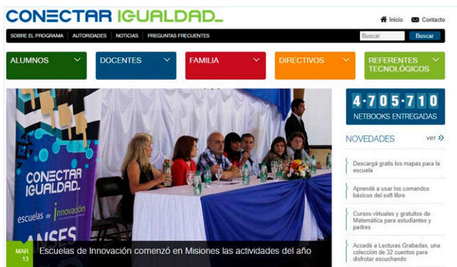
Figura 4. Página de inicio del sitio web del Programa Conectar Igualdad.