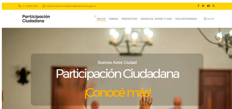
Figura 1. Página de inicio del sitio web de Buenos Aires Participación Ciudadana.

En cuanto al formato de la página web, presenta en el inicio una imagen principal en movimiento hacia afuera y hacia adentro (zoom in/zoom out) que va variando y un texto que cae sobre la imagen: “Buenos Aires Ciudad. Participación Ciudadana. ¡Conocé más!”. Más abajo, hay un link hacia la “agenda semanal” y por debajo cuatro textos informativos con los títulos “Vecinos participando”, “¿Sabés qué es Participación Ciudadana?”, “¿Cómo podés ser parte?” y “Sigamos transformando juntos la Ciudad”. Por último, aparece una pestaña llamada “Últimas iniciativas participativas” y, en la parte inferior de la página, nuevamente la información de la página principal, los accesos directos y los contactos.