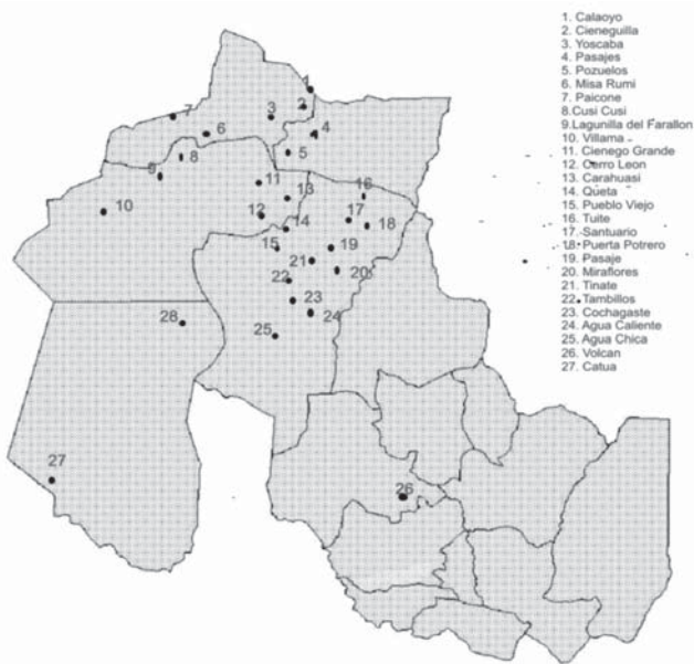
Figura 1 Mapa representativo de la distribución geográfica de los productores ganaderos en la provincia de Jujuy ( 24^{\circ} 01' S - 65^{\circ} 25' O ). Cada punto numerado se corresponde con una localidad citada al margen. (Autorizada su reproducción por Marín R.E. "Prevalencia sanitaria en llamas de la provincia de Jujuy". Gacetilla de Divulgación técnica, Ministerio de Producción de Jujuy, 2006).