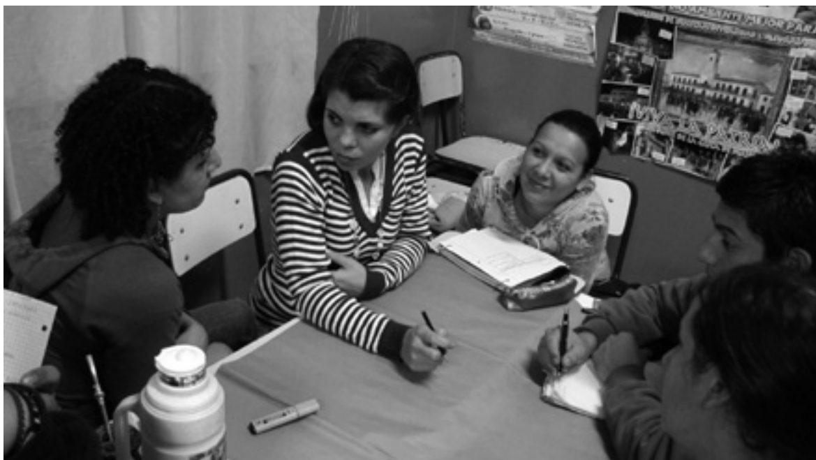
Bachillerato 2 de diciembre.