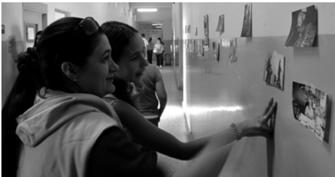
Bachillerato 2 de diciembre.

dagógicas que ponemos en juego para el logro de nuestros objetivos que pueden distinguirse en dos grupos: las estrategias relacionadas con el plan de estudio y el trabajo específico en cada área y las estrategias que trascienden las áreas e involucran a la totalidad del colectivo docente.