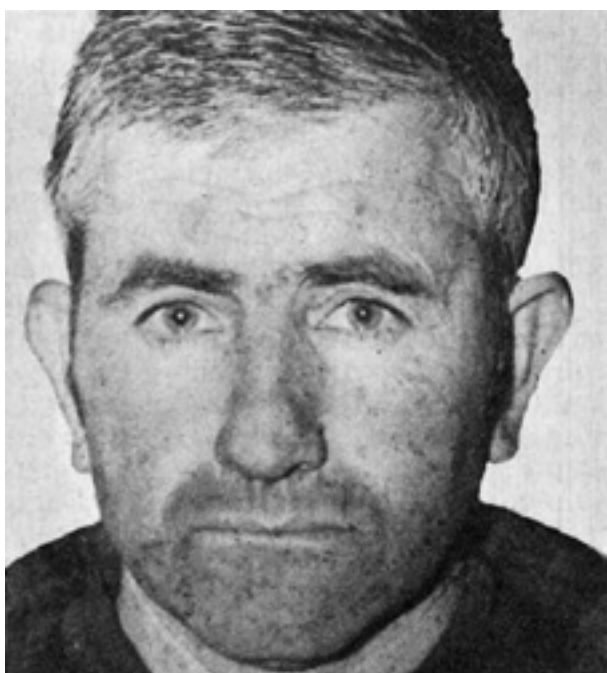
La figura de Raúl Sendic, fundador de UTAA y referente de la izquierda uruguaya.