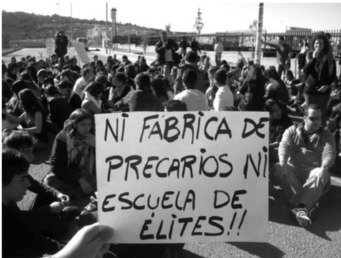
Manifestación contra del Plan Bolonia / España.

y para el cierre de los centros de identificación, detención y deportación para migrantes, y mas. Una gran variedad de cuestiones que han brindado las herramientas teóricas y políticas para el fortalecimiento de la lucha por la emancipación han sido y siguen siendo desarrollada dentro de los cursos autogestionados, como la reconstrucción genealógica de las transformaciones de la misma universidad, la crítica de la democracia y la investigación en torno a las experiencias de las instituciones comunes, mas allá de el público y el privado, y así sucesivamente. Una universidad desde abajo, conflictual y radicalmente antagonica al modelo oficial se ha desarrollado en los escombros de la universidad pública, con una fuerte tensión para la expansión del proceso en sí mismo, el ejercicio de la crítica y el conflicto. La organización de seminarios de autoformación se convierte en sí mismo un momento de la organización política, identificando en la conexión entre investigación y acción política un elemento clave para transformar la universidad en un espacio de conflicto con la perspectiva de la li-