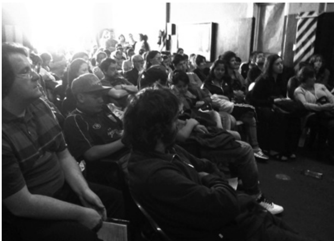
Clase pública en IMPA.