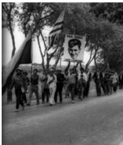
Segunda marcha de los cañeros.