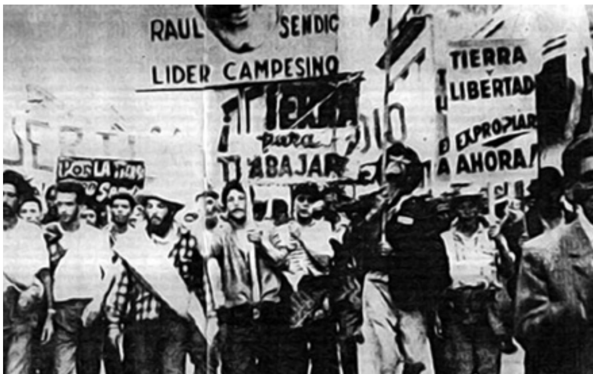
Los cañeros llegan a Montevideo en la Segunda Marcha.