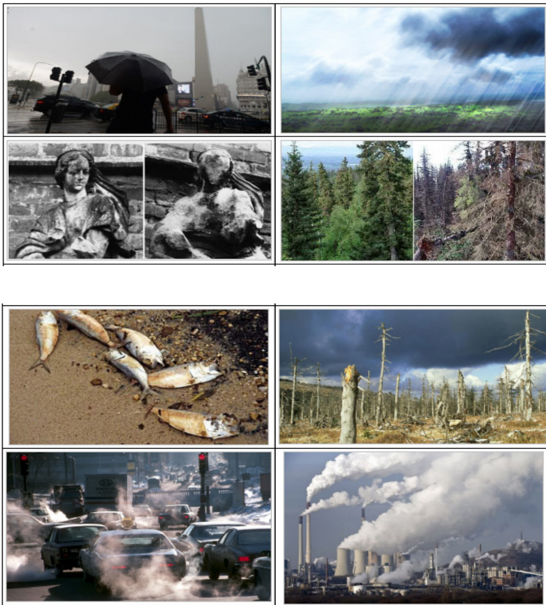
Figuras 1 – 8. Fotografías para imprimir y recortar. Tarjetas alusivas a las causas y consecuencias de la lluvia ácida.

3 – Preparar la propuesta para debatir con el resto de la clase.