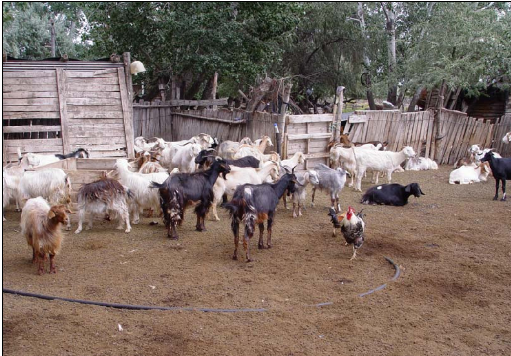
Figura 1. Hato de un productor en los corrales de encierre. Nótese la precariedad de los mismos.