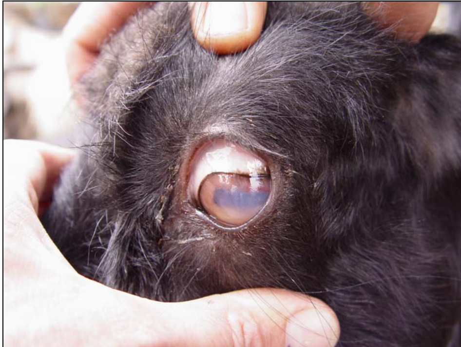
Figura 3. Cabra adulta con una "nube" en un ojo, compatible con una secuela de queratoconjuntivitis.

En las figuras 3 y 4 pueden observarse animales con lesiones de queratoconjuntivitis y ectima contagioso.