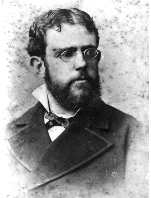
Figura 3. Francisco P. Moreno. Foto de archivo del Museo Argentino de Ciencias Naturales “Bernardino Rivadavia” / Francisco P. Moreno. Photo from the Archives of the Museo Argentino de Ciencias Naturales “Bernardino Rivadavia”.

Distintas fueron las causas que ambos personajes brindaron para justificar la ruptura. Ameghino (1888, en Ameghino 1889, p. XIV) públicamente argumentó que se retiraba por la imposibilidad de publicar sus trabajos, dado que Moreno había suspendido las publicaciones del museo y prohibido que se publicara por otros medios gráficos. Moreno, en forma privada, respondió al argumento de Ameghino y adujo que el alejamiento se produjo al ser descubierta su participación en una conspiración para destituirlo (Moreno, 1888). Durante el siglo XX muchos de los autores que abordaron esta problemática consideraron la ruptura como el epílogo de un enfrentamiento marcado por la presencia de celos profesionales, incompatibilidad de caracteres y una conducción incapaz de contemplar los intereses particulares de sus subordinados (Cabrera, 1944; Márquez Miranda, 1951; Ygobone, 1953). Podgorny y Lopes (2008) enmarcaron el conflicto en un creciente clima de tensiones originado en la quita de apoyo económico