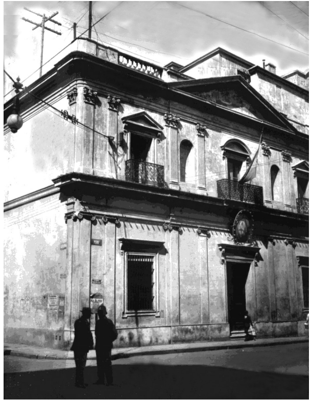
Figura 2. Museo Público de Buenos Aires en la Manzana de las Luces. Museo Público de Buenos Aires in the Manzana de las Luces.

de Burmeister fue completo ya que su intervención permitió que las colecciones provinciales formasen parte del nuevo Museo Nacional, del cual fue nombrado Director (Lopes, 2000, p. 278). Por otra parte, las colecciones del otrora Museo Antropológico fueron trasladadas a La Plata, la nueva capital bonaerense. El 17 de septiembre de 1884 se fundaría así el Museo de La Plata (Barba, 1977; De Santis, 1977) (Fig. 4). A partir de ese momento, Moreno, director de dicha institución, inició una veloz carrera contra reloj para que la misma se erigiera. El apoyo económico brindado por la provincia a través de su gobernador Carlos Alfredo D’Amico fue clave tanto en la construcción edilicia como en la compra de un importante número de colecciones (Podgorny y Lopes, 2008, Podgorny 2009, Farro, 2009). Así, el 20 de julio de 1885 se llevó a cabo la primera inauguración parcial con la apertura de las salas de Geología, Paleontología pampeana, Zoología actual, Anatomía comparada y Cultura humana (Podgorny y Lopes 2008; Farro, 2009). El Museo de La Plata surgió sin personal científico y Moreno estaba dispuesto a solucionar ese inconveniente ya que su experiencia le indicaba que los ejemplares de los fósiles no sólo pertenecían a quien los recolectaba sino también a quién los daba a conocer y