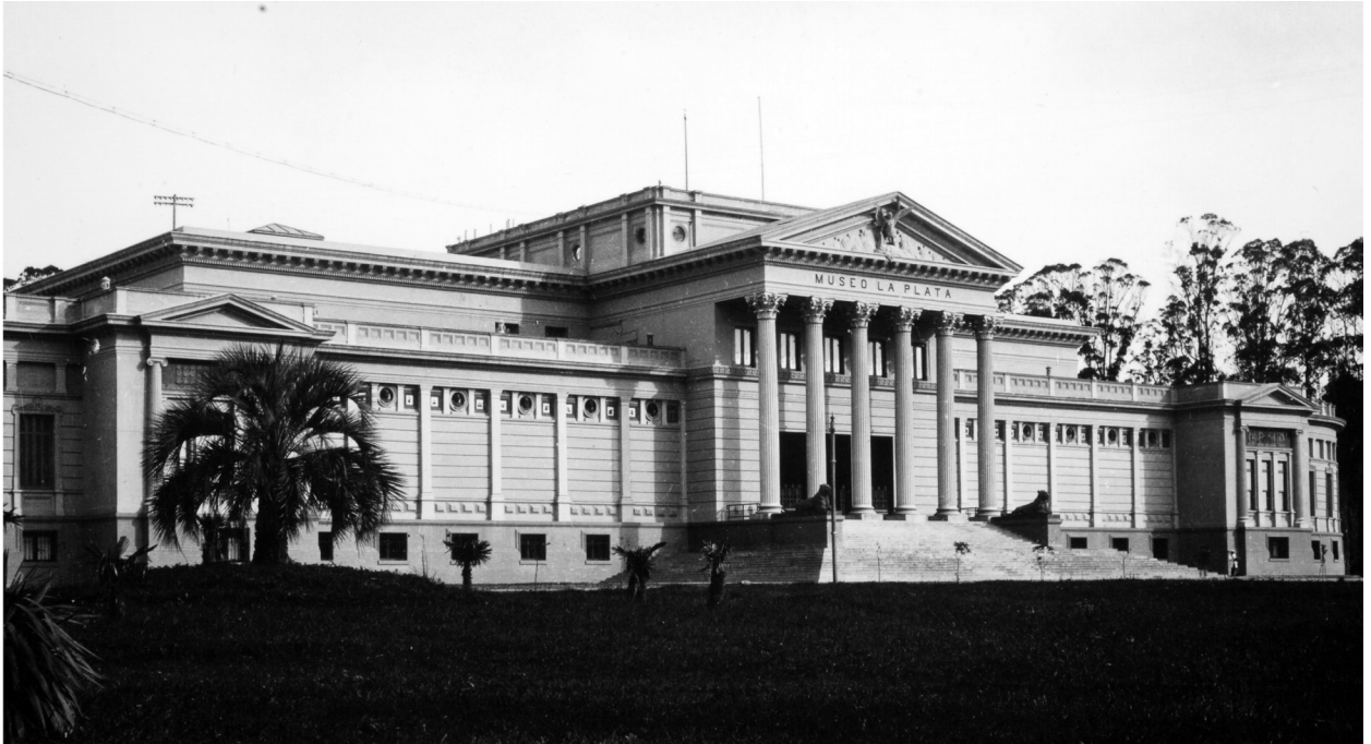
Figura 4. Museo de La Plata.

Se puede decir que la única actividad que Moreno reservó para sí fue la obtención de fondos. Al respecto, cabe destacar que a principios de 1887 ya se vislumbraba la fuerte crisis financiera que azotaría a la provincia (Márquez Miranda, 1951) y la falta de apoyo institucional que el futuro gobernador de la provincia Máximo Paz le brindaría al Museo (Podgorny y Lopes, 2008; Podgorny 2009). En este contexto, Moreno (Carta 453, en Torcelli, 1935) le escribió a Ameghino el 26 de febrero comentándole lo que había resuelto: