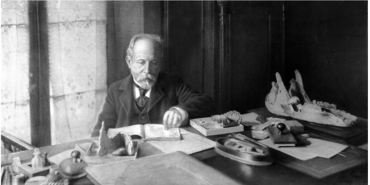
Figura 5. Florentino Ameghino en el Museo Nacional de Buenos Aires. Florentino Ameghino in the Museo Nacional de Buenos Aires.

al vender sus propiedades (Carta 453, en Torcelli, 1935).