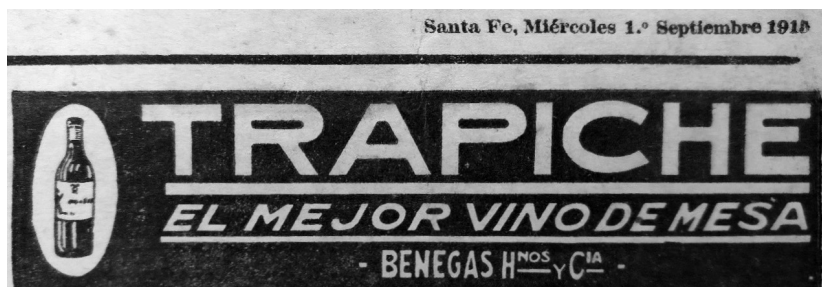
Figura 1. Vino Trapiche, anuncio en la primera plana del diario Nueva Época .