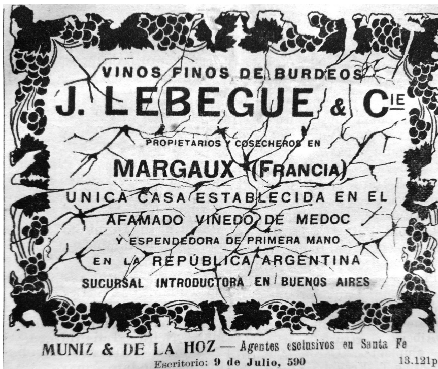
Figura 2: Vinos Finos de Burdeos J. Lebegue.