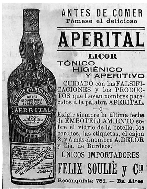
Figura 3. Aperitivo Aperital.