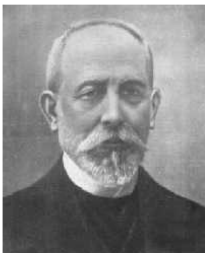
Figura 1. Florentino Ameghino (1854-1911)