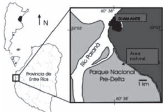
Figura 1. Ubicación del área de estudio. Modificado de Aceñolaza et al. (2004).

La ciudad de Diamante se encuentra ubicada en el centro-oeste de la provincia de Entre Ríos (Argentina) 32° 03'437 S – 60° 38'388 O, a orillas del Río Paraná (Figura 1). El departamento Diamante (según datos