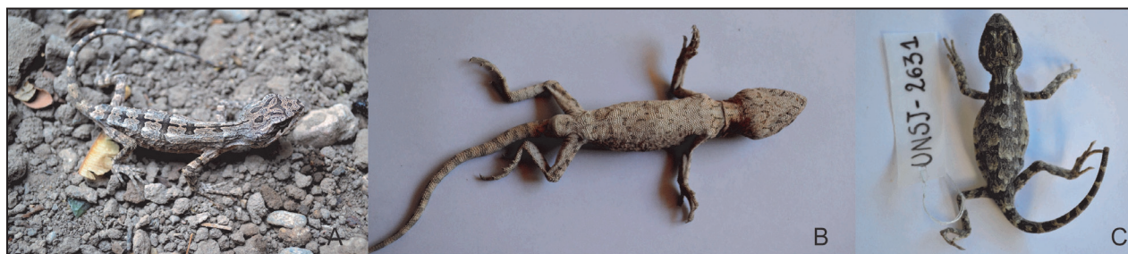
Figura 2. Vista dorsal (A) y ventral (B) del ejemplar hembra (LHC 79 mm; UNSJ-2630), y vista dorsal (C) del juvenil (LHC 44 mm; UNSJ-2631) de Leiosaurus paronae colectados en La Majadita, Valle Fértil, provincia de San Juan.

(Peracca, 1897; Gallardo, 1961; Cei, 1986, 1993). El ejemplar hembra examinado presenta una pequeña cresta nucal y dorsal sobre la línea vertebral, siendo más pronunciada en la región nucal, correspondiente a escamas cónicas puntiagudas; dorsolateralmente posee escamas cónicas pronunciadas que forman hileras irregulares. En la región cefálica se observan escamas irregulares prominentes y poliédricas. Ausencia de escamas rostral y mentoniana. Las narinas se ubican más cerca del hocico que de la región ocular. Ventralmente exhibe escamas subtriangulares imbricadas débilmente quilladas. Presenta escamas subdigitales tri a pentacarenadas y caudales evidentemente quilladas.