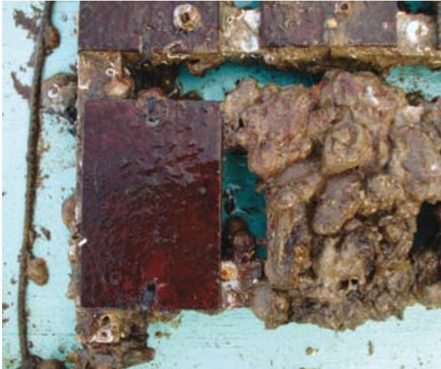
Foto 2. Panel de control con un derivado de tanino de tara expuesto por ocho meses en el mar.

de estas pinturas no ha llegado a ser la misma que las que contenían TBT.