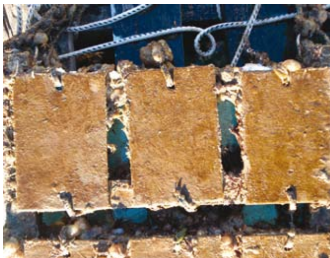
Foto 1. Muestra de pintura con un derivado de tanino de tara expuesto por ocho meses en el mar.

Los controles sobre los sistemas AI por parte de estados