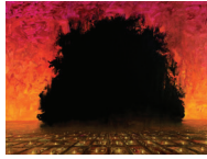
FIGURA 4. El árbol del olvido, 2008, fotografía cortesía Juan Doffo

La idea de El árbol del olvido surgió en el artista luego de visitar un cementerio del siglo XVIII en Concordia, Entre Ríos. Allí el artista se topó con un árbol lleno de vida que increíblemente creció bajo una antigua bóveda, esta fue su inspiración para la primera obra de la serie. Juan Doffo evoca la imagen del árbol que según los celtas fue el primer ser vivo en la tierra. Rescata en esta obra la unión entre cielo y tierra que hay en el árbol que considera que también la hay en el hombre. Quizás en ese margen entre el olvido y la memoria, el artista rescata aquellas memorias subterráneas de una antigua pampa que guarda mucha actualidad. Según me explica el artista: “Arriba está el árbol y abajo puse al pueblo. Esta obra surgió de una idea medio tétrica de que el muerto olvida todo, y entonces hice ese gran espacio negro que representa ese momento en que uno va a olvidar todo. A mí me impresiona mucho eso”.