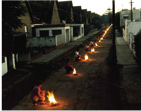
FIGURA 1 Arquitectura al infinito 2001