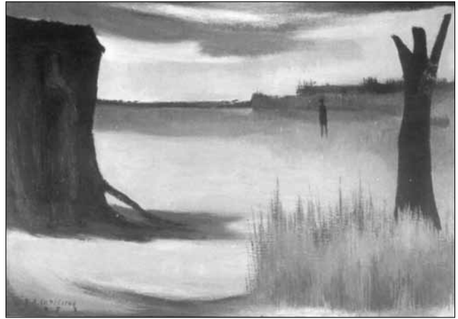
Gráfico 4. El campo artístico y su mirada. Ricardo Supisiche 1957. El árbol (óleo sobre tela).

En estas condiciones, surgirá en Santa Fe un fenómeno de expansión urbana privada sin precedentes: el country , denominación local que sigue el modelo del suburbio