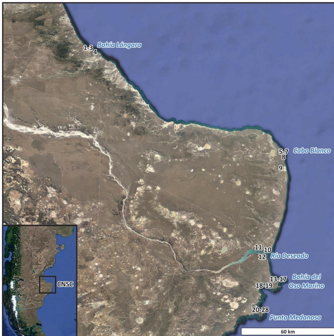
Figura 1. Ubicación de los sitios arqueológicos con especímenes avifaunísticos en la Costa Norte de Santa Cruz. Referencias: 1) Palo Alto; 2) Palo Caído; 3) Puente de Hierro; 4) Sitio Moreno, comp. 1; 5) Cabo Blanco 1; 6) Cabo Blanco 2; 7) El Piche; 8) Laguna del Telégrafo; 9) Médanos del Salitral; 10) UNPA; 11) Alero 4; 12) Puerto Jenkins 2; 13) Playa del Negro; 14) Cueva del Negro; 15) Las Hormigas; 16) Los Albatros; 17) Alero El Oriental; 18) Sitio 112; 19) Isla Lobos; 20) Sitio 160; 21) Médano 1; 22) Punta Buque; 23) Puesto Baliza 1; 24) Puesto Baliza 2; 25) Punta Medanosa 1; 26) Punta Medanosa 2; 27) Punta Medanosa 3; 28) Punta Medanosa 4.

algunos muestreos se observó la presencia de indicadores antrópicos, especialmente de huellas asociadas al procesamiento y consumo humano, principalmente marcas de corte (Laroulandie 2005; Lyman 1994; Miotti 1990-1992; Marani y Borella 2014). En la mayoría de los casos se empleó la información publicada y, en unos pocos, los datos disponibles en los trabajos de investigación del proyecto marco que aún no se encuentran publicados.