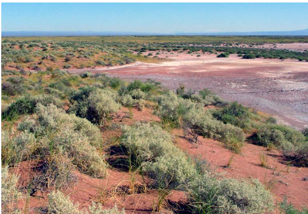
Fig. 2. Vista del Salar de Añelo, Provincia de Neuquén.