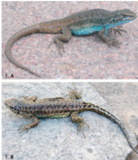
Figura 1. Ejemplares vivos de Liolaemus coeruleus macho (1.A) y Liolaemus neuquensis macho (1.B). Figure 1. Alive individuals of Liolaemus coeruleus male (1.A) and Liolaemus neuquensis male (1.B).

El patrón de coloración de los machos difiere entre ambas especies, ya que L. coeruleus muestra una peculiar tonalidad celeste en flancos y vientre, con dorso castaño-azul oscuro, mientras que L. neuquensis exhibe flancos y vientre verde oliva claro y dorso verde oscuro-castaño, con series de manchas negras irregulares transversas paravertebrales y mancha oscura occipital (Figura 1). En las hem-