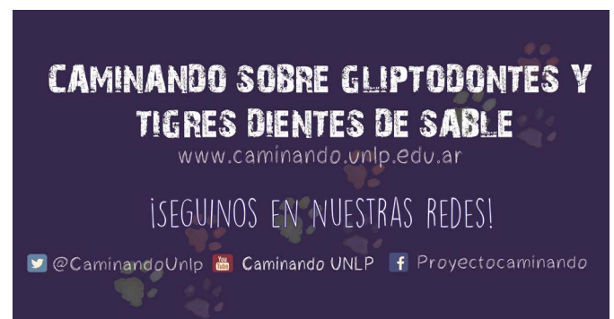
Caminando sobre gliptodontes y tigres dientes de sable en redes sociales

individuos, ponemos en juego a los fósiles como bien patrimonial. Concluimos que un objeto cobra valor patrimonial cuando se comparte, es reconocido y sentido como propio por la comunidad. Esto es la base y razón por la cual las personas nos sentimos parte de un conjunto mayor que llamamos sentido de pertenencia; que puede ser local, nacional e incluso mundial. Así, el patrimonio juega un rol importante en nuestra identidad y su fuerza no proviene del objeto, sino de las personas que se apropiaron de él (SALGADO-AHUMADA; MONTERO; IACONA et ál., 2017). Apropriarnos del patrimonio es hacer parte de nosotros aquello que tiene un valor para la comunidad, entendiendo que no todos tenemos los mismos roles u obligaciones. Por ejemplo, los paleontólogos tienen responsabilidad en el descubrimiento, conocimiento, resguardo y divulgación de los fósiles; las instituciones deben trabajar junto a la comunidad local para darle valor educativo e identitario y velar por su cui-