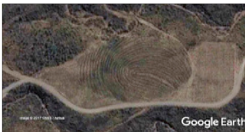
Figura 2. Huella de viñedos.

El caso 5 es el más joven (2011) y pequeño (85 has., con 60 has. de viñedos). Como elemento distintivo, la “identidad” se posiciona como producto estrella, al punto de lograr expresión material en el logotipo que oficia de presentación. Las etiquetas de los vinos premium contienen como isotipo un conjunto de huellas dactilares de los propietarios. Una de estas imágenes ha sido reproducida en la traza de un viñedo perceptible satelitalmente, que media como portal de ingreso al emprendimiento (Figura 2).