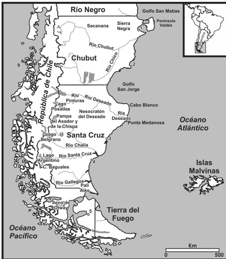
Figura 1. Ubicación de las fuentes de obsidiana, accidentes geográficos y sitios arqueológicos mencionados en el texto. Referencias: 1) Médano Grande; 2) Cabo Dos Bahías; 3) La Mina; 4) P. N. Monte León; 5) Marazzi.

(47° 50' S y 70° 59' O), representa un área de aproximadamente 15 x 80 km y se emplaza entre 1100 y 650 msnm (Figura 1). Está conformada por sedimentos fluvio-glaciares con abundantes rodados de obsidiana riolítica, basaltos y rocas silíceas presentes en superficie, principalmente concentrados en drenajes activos (Stern 1999). A 30 km al este de PDA, en un abanico aluvial y al sureste, en Pampa de la Chispa, se registran rodados de la misma obsidiana que por lo general presentan menor tamaño (Belardi et al. 2006). Hasta el momento, se ha registrado la existencia de al menos tres tipos químicamente diferenciales de obsidias de PDA (Stern 1999; 2004). Los tipos PDA I y PDAII son