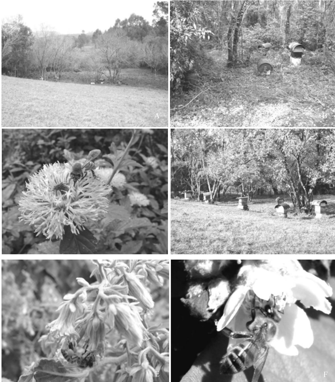
Figura 3: A-B-D: Vista panorámica del área de estudio. C-E-D: Abejas libando flores de especies de Asteraceae y Rosaceae.