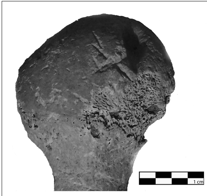
FIGURA 2 • EXTREMO PROXIMAL DE FÉMUR DE LAMA GUANICOE CON MARCAS DE CORTE.