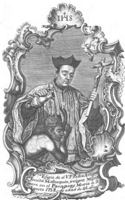
Ilustración 2 - Estampa del P. Pedro Antonio Artigas del artista Antonio Muntaner de 1762 inserta en el libro biográfico del P. Andreu (1762).

personas, entre los que se encontraba el mismo cacique. Todas las intenciones se paralizaron hasta que en el año 1755 volvió el P. Andreu junto al P. Pedro Antonio Artigas 9 (Ilustración 2), quien llegaba de misionar entre los isistines de Balbuena, para reemplazar al P. del Bono.